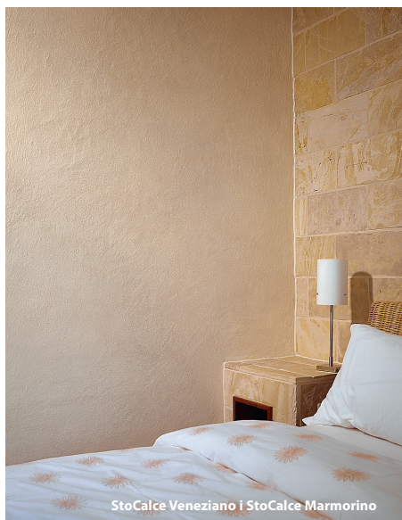
StoCalce Veneziano i StoCalce Marmorino